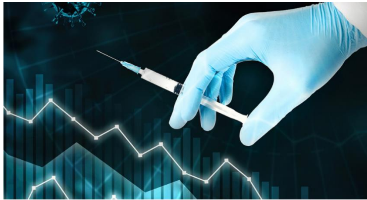
ลัมเหลวโดยสิ้นเชิง

เว็บไซต์ : https://www.thairath.co.th/news/local/2219175