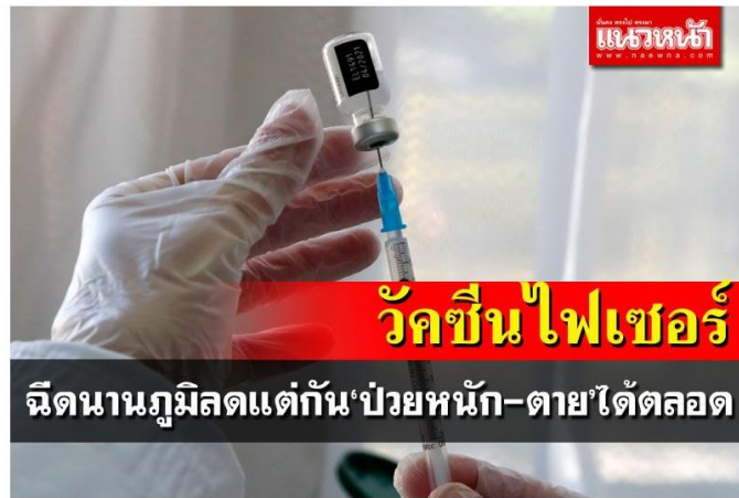
วิจัยใหม่3ประเทศชี้ตรงกัน 'ไฟเซอร์'ภูมิลดหลัง6เดือน แต่กัน'ปวยหนัก-ตาย'ได้ตลอด

เว็บไซต์ : https://www.naewna.com/local/608948